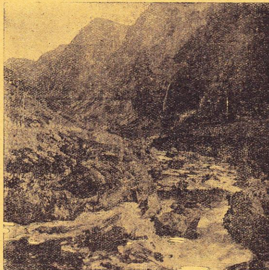
Norvège. — Vallée du Naerodal.

Tirage attesté de ce numéro 43,000 exemplaires