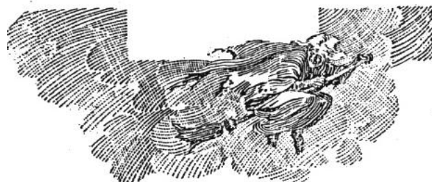
Table des matières du " Diable en Belgique " Roberto J. PAYRO (ou Payró ) : IEA3637 PARTIE 1 (pages I-37 : " LE DIABLE ARCHITECTE ", " UNE CREATURE D'APOCALYPSE " (LE " VERT-BOUC "), " LE PACTE AVEC LE DIABLE ", " LE STRATAGEME

Le Diable EN BELGIQUE : légendes fantastiques, recueillies en Belgique par Roberto J. Payró entre 1909 et 1923 traduites, présentées et commentées par B. GOORDEN Attaché à la Bibliothèque Royale Albert Ier.